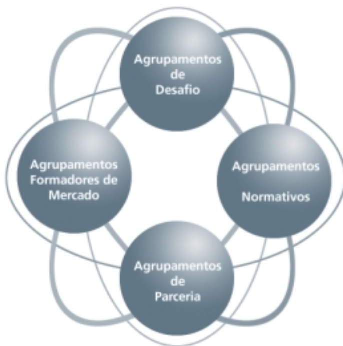
Figura 1: Agrupamentos de responsabilidade corporativa

As relações no mundo real entre agrupamentos de responsabilidade corporativa e competitividade foram examinadas por meio de diversos estudos de caso, várias entrevistas com formadores de opinião e um levantamento bibliográfico. O resultado desse trabalho foi a identificação de diversos tipos de agrupamentos de responsabilidade corporativa, ou estágios de seu desenvolvimento, conforme resumimos a seguir. Esses estágios não seguem necessariamente o mesmo padrão de evolução, e, além disso, a dinâmica e os impulsos mudam conforme o tipo de economia, indústria ou comércio.